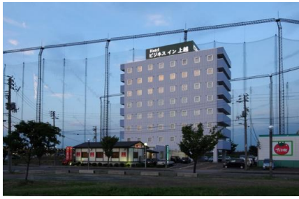
ビジネスイン上越外観