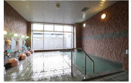
大浴場（男女時間入替制）