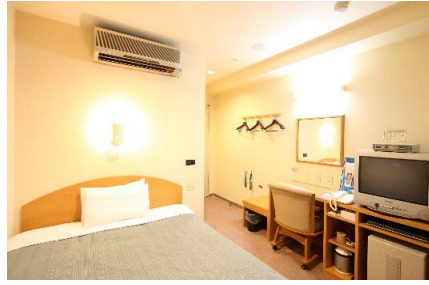
シングルルーム室内