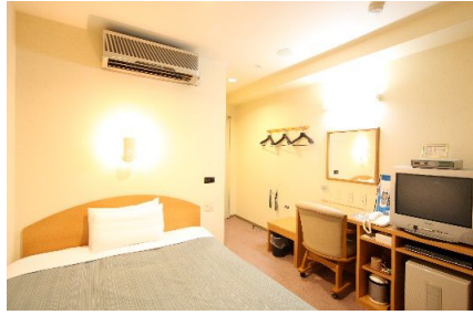
シングルルーム室内