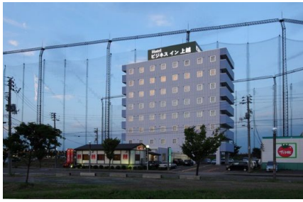
ビジネスイン上越外観