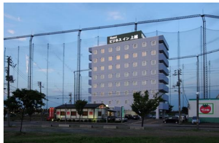
ビジネスイン上越外観