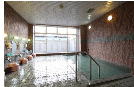
大浴場（男女時間入替制）