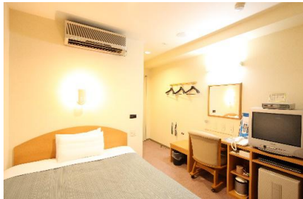
シングルルーム室内